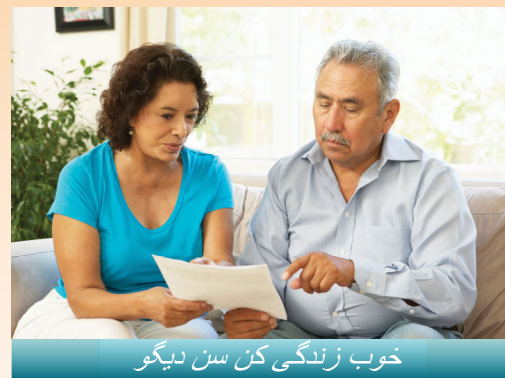
خوب زندگی کن سن دیگو

خدمات سلامت روان تخصصی از طریق طرح سلامت روان کانتی سن دیگو ارائه می شود، که جدا از مراقبت های سلامت جسمی شما است. طرح سلامت روان مسئول ارائه خدمات سلامت روانی با کیفیت برای بزرگسالان واجد شرایط، افراد مسن و کودکانی است که با مشکلات جدی و مزمن روانی مواجه هستند. خدمات سلامت روان محرمانه هستند و بر اساس این باور که مردم می توانند بیماری روانی خود را درمان کنند و درمان می کنند شکل گرفته اند. اگر چه درخواست کمک برای مشکلات سلامت روان ممکن است چالش برانگیز باشد، با این حال کمک تنها با یک تماس تلفنی انجام می شود.