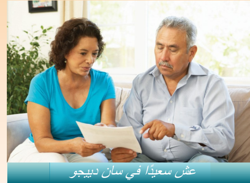
عش سعيدًا في سان دييغو

مشاكل الصحة العقلية الخطيرة والمستمرة. خدمات الصحة العقلية محاطة بالسرية وهي تستند على الاعتقاد بأن في إمكان الناس الشفاء من المرض العقلي وهم يشفون منه. على الرغم من أن طلب المساعدة لحل مشاكل الصحة العقلية يمكن أن تشكل تحديًا، فإن المساعدة على بعد مكالمة هاتفية.