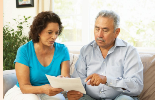
عش سعيداً في سان دييغو

مشاكل الصحة العقلية الخطيرة والمستمرة. خدمات الصحة العقلية محاطة بالسرية وهي تستند على الاعتقاد بأن في إمكان الناس الشفاء من المرض العقلي وهم يشفون منه. على الرغم من أن طلب المساعدة لحل مشاكل الصحة العقلية يمكن أن تشكل تحدياً، فإن المساعدة على بعد مكالمة هاتفية.